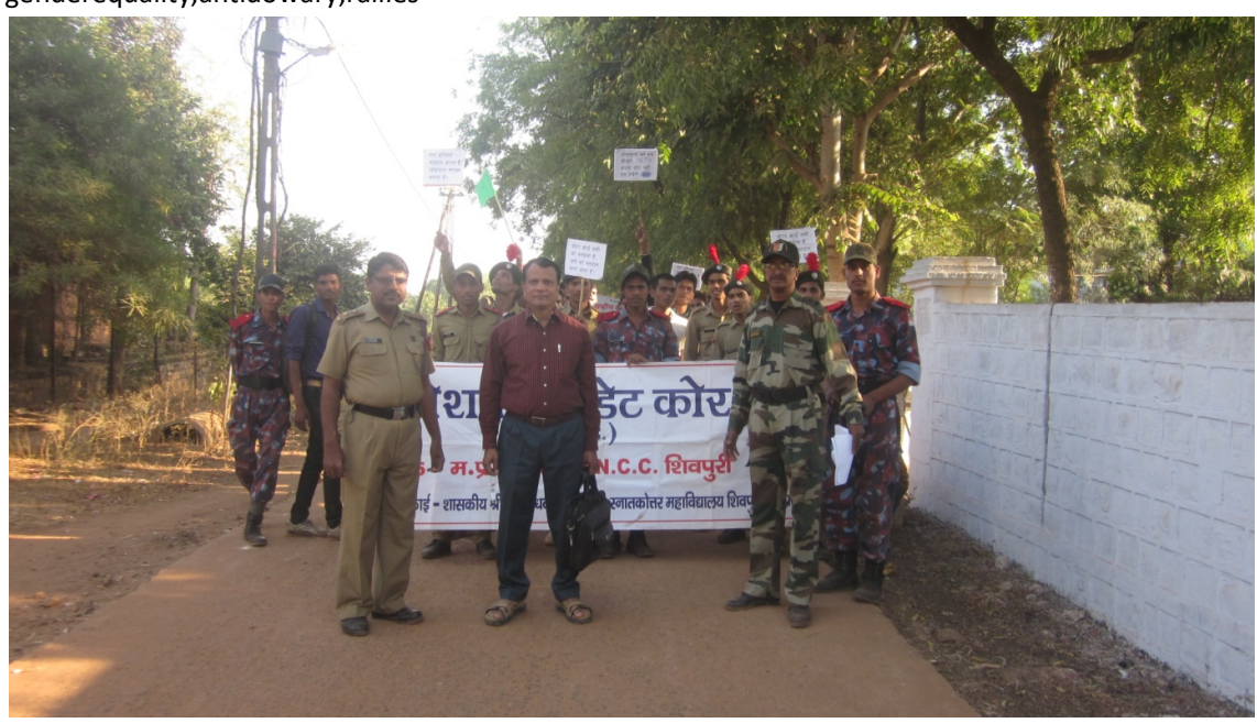
genderequality, antidowary, rallies